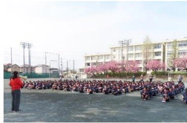
【春期藤沢・湘南大会 サッカー・女子バスケ・男子バスケ】