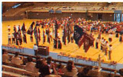
(総合開会式の様子)