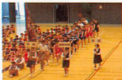
(開会式で行進する本校選手団)