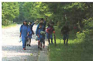
【オリエンテーリング】