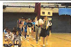
【開会式での本校選手】

また、6月27日(木)には、秋葉台文化体育館において市内各校の代表選手が参加して藤沢市総合体育大会総合開会式が開催されました。本校からも各部活から3年生を中心に22名の選手が参加し、堂々とした入場行進を披露してくれました。