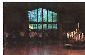
【キャンドルファイヤー】