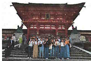
【伏見稲荷大社(クラス別)】

「5分前行動は当たり前。最後は10分前行動」「食堂の方や、教室の方や、バスの運転手さんにも、元気なあいさつ」「ゴミが落ちていれば、自分のものではなくても拾う」「楽しむ時は全力で楽しむ」ことができる1年生。もちろん、反省点もありましたが、今後のみなさんの成長がますます楽しみになった3日間でした。(大川教頭先生談)