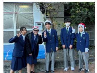
生徒会あいさつ活動にて

オンラインでグループごとに各校の取組について情報交換しました。羽鳥中からは、「いじめ防止週間」、仲間づくりのための「あいさつ活動」「生徒会月1レク」について話をしました。