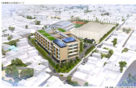
新校舎完成予想図

鵜沼中学校再整備計画が行われていますが、新校舎建築場所となる現グラウンド南側の地盤地質調査が行われています。調査の完了は12月の初旬を予定しています。ボーリングを行うために金属打撃音やエンジン音が響くこともありますが、テスト