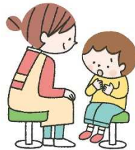
相談やクールダウンの件数