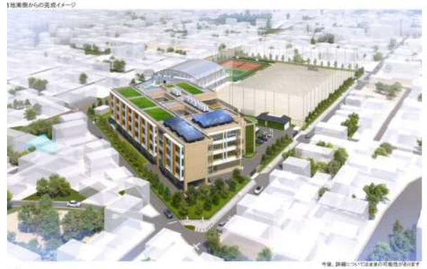
完成予想図（南方向から見た図）

工事中の保健体育の授業や運動部の活動については市教育委員会とも協議を行っていますが、放課後の部活動については近隣の小学校グラウンドをお借りする方向で調整が行われています。