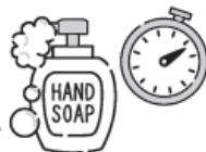
手洗いによるウイルス減少のイメージ図

石けんで時間をかけて手洗いをするので、手についた細菌・ウイルスを大きく減らすことができます。