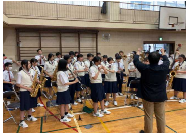
壮行会(吹奏楽部演奏)