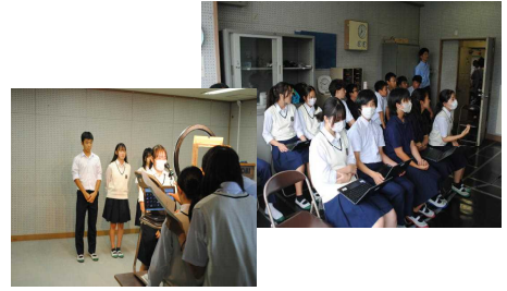
生徒総会(リモート)

また6月27日(木)には生徒総会がリモート形式で行われ、本部役員と各専門委員会の代表が、今年度の活動方針等について説明をしました。オンラインではありましたが、とても真面目な態度で臨んでいることが感じられて、充実した生徒総会となりました。