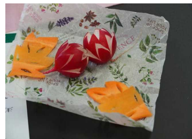
ベジタブルカービング

5月28日(火)・5月30日(木)キャリア学習として「仕事の学びJr.」を行いました。高等専修学校の先生方に講師として来ていただき、体験を通じて将来の職業について考える機会を持ちました。[ベジタブルカービング][ギター演奏][カレンダー&はがきづくり][缶バッジ製作][キュウリの飾り切り][ネイルアート][バリアート][DTM作曲][表計算・ブラインドタッチ]