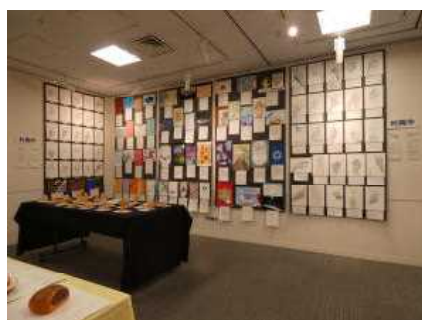
藤沢市中学校美術展

藤沢市中学校美術展が10月28日(火)～11月2日(日)藤沢市民ギャラリーで、また、藤沢市総合かがく展が10月16日(木)～22日(水)湘南台文化センターこども館で開催されました。本校からも作品が何点か展示され、たくさんの方々に見てもらうことができました。