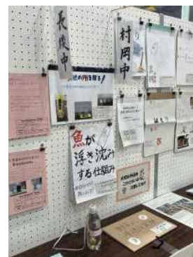
藤沢市総合かがく展

藤沢市中学校美術展が10月28日(火)～11月2日(日)藤沢市民ギャラリーで、また、藤沢市総合かがく展が10月16日(木)～22日(水)湘南台文化センターこども館で開催されました。本校からも作品が何点か展示され、たくさんの方々に見てもらうことができました。