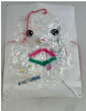
美化委員会「ゴミアート」