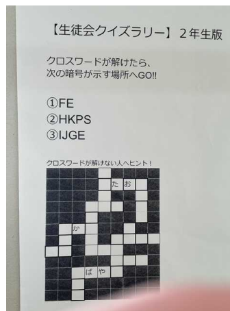
生徒会「ウォークラリー」 体育委員会「体力測定」