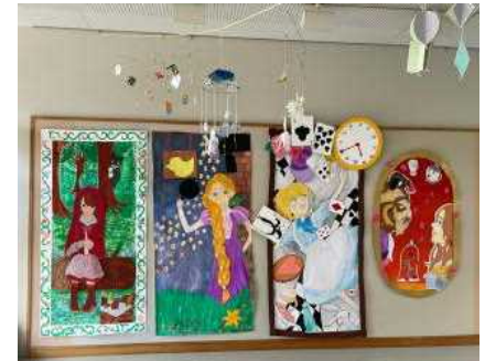
美術部「立体ウォールアート」