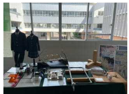
藤沢工科高校「学校紹介」