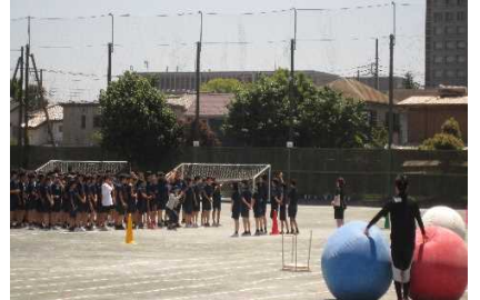
↑リーダーズの皆さんの手作り