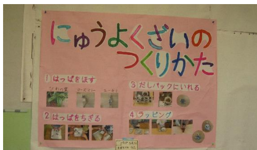
神奈川県立藤沢支援学校