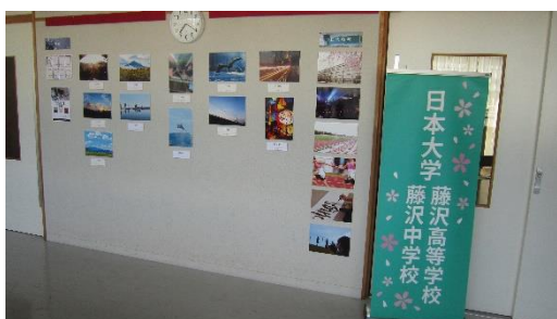
日本大学藤沢中学校・高等学校