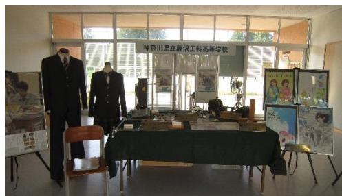
神奈川県立藤沢工科高校