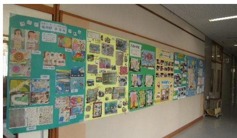
学園都市むつあい協力者会議