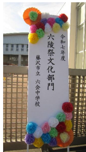
七色の花が咲く看板