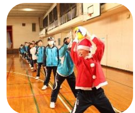
1年クリスマス集会 真剣に楽しんでます