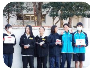
赤い羽根募金 ご協力ありがとうございました