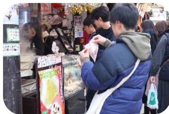
横浜の文化を体験中 やはり中華街は欠かせない