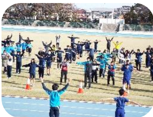
がんばるぞ! 準備運動にも気合いが入ります