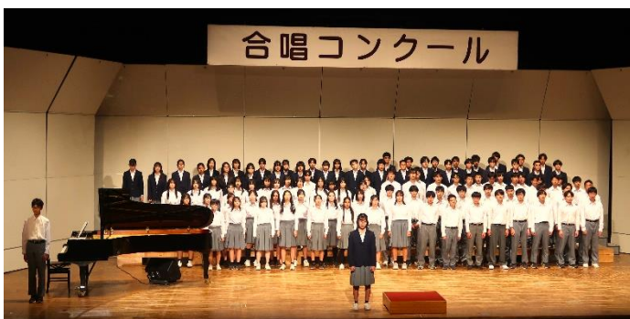
↑ 伝える気持ち、ハーモニーの美しさ、圧巻でした。