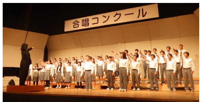
↑ 手話と歌と歌詞に感動。心に響く温かい合唱でした。