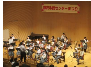
←力作揃い↑ 自分自身をダルマの分身で表現 1、2年生バンドのデビュー！

<中学校音楽会> 「地球の鼓動」「時の旅人」 夏休みも練習した成果を発揮。そのハーモニーは聴衆を 沸かせ、大きな拍手に包まれました。