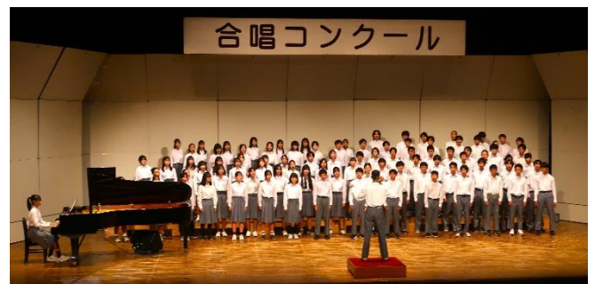
5組と市内音楽会有志合唱団 「明日へ」