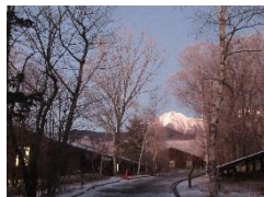
1年 ハケ岳体験学習