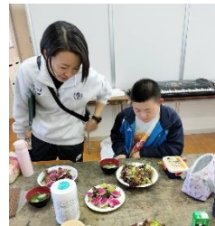
自家製野菜で彩りサラダ