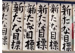
2年書写 新たな目標