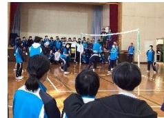
体育委員会主催 クラス対抗バレーボール大会