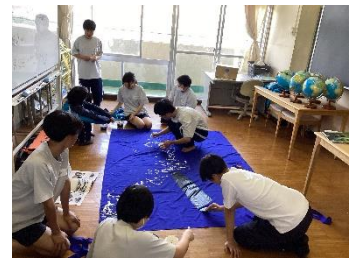
↑体育祭 シンボルマーク作成中

「ともに生きる社会」を目標に、運動の得意不得意に関わらず、また通常の学級・特別支援学級の生徒と一緒に活躍できる、そんな体育祭を生徒たちと一緒に作っていきます。