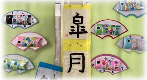
↑5組作品 色とりどりのこいのぼり

学校ホームページ http://www1.fujisawa-kng.ed.jp/johsh/