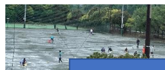
準備:水抜き泥だらけ