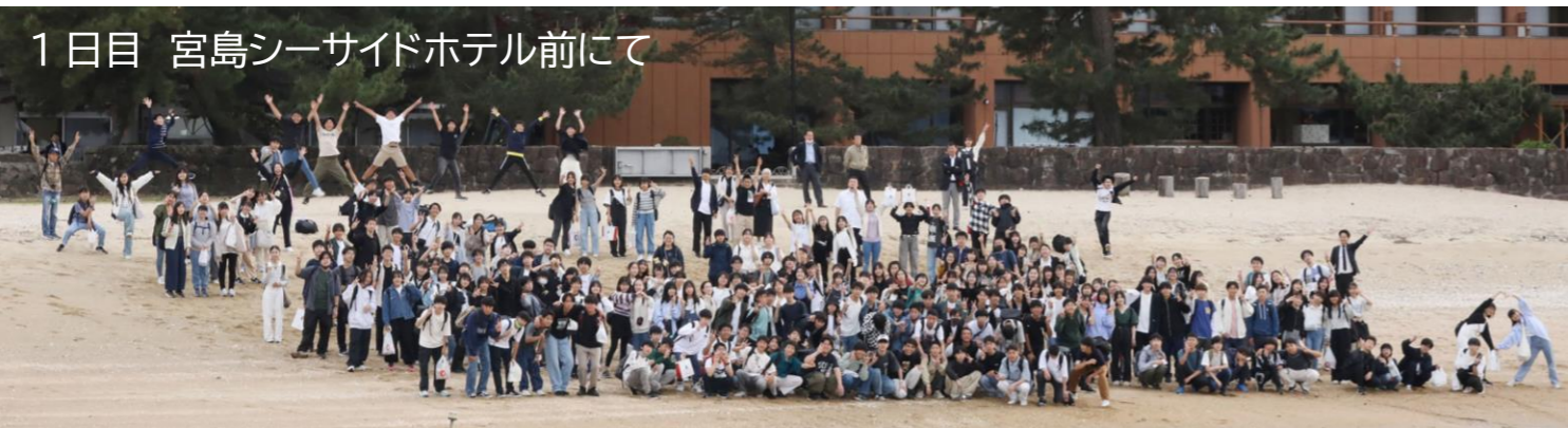
1日目 宮島シーサイドホテル前にて

5月11日(土)～13日(月)に、広島・京都方面へ待ちに待った修学旅行に行ってきました。昨年度末からクラスや班で入念に準備を進め、当日を迎えました。初日は、広島と言うことで、平和記念公園や原爆資料館で日本の平和を学習し、改めて戦争の恐ろしさや平和の有り難さを実感しました。その後、宮島に行きました。さすが世界遺産！海の中に建つ寝殿造りの社殿群と大鳥居から成る厳島神社は、圧巻でした。ラッキーなことに潮が引いていたので大鳥居まで行くことができ、大満足の1日目でした。2日目は、心配された天気も小雨で、一路京都へ向かいました。どの時期でも大混雑の京都。しかもこの日は、日曜日ということもあり、どこもかしこも人・人・人！！路線バスに至っては乗れない観光客もたくさんいました。幸い子どもたちは、各班タクシーを使い効率よく、自分たちの行きたいところを多い班では5カ所ぐらい巡り、京都を堪能しました。そして、この日の夜は、クラスごとにバイキングディナー。子どもたちの感想では、「たくさん食べたー」「このケーキおいしい!!」など楽しめたようです。中には、「やっぱりご飯はみんなで一緒に食べたかった」という感想もありました。そして、あつという間の最終日。この日は、クラス別行動。王道は、北野天満宮、金閣寺、竜安寺。一部、平等院や、船に乗る予定のクラスもありました。最後は、嵐山に集まり、お土産選びと昼食。各自思い思いに、お土産を考える姿が印象的でした。帰りの新幹線は、疲れて爆睡する人と最後まで元気に楽しく遊んでいる人と様々でした。こうして、3日間、大きな事故やケガ、体調不良もなく無事に行き帰ることができました。子どもたちは、3日間寝食を共にしたことでさらに絆も深まり、クラスも仲良くなったように思います。これからの体育祭、合唱コンなどの行事や高校受験などにもつながる貴重な体験になりました。保護者の皆様には、費用のご負担やご準備など、ご協力いただきありがとうございました。