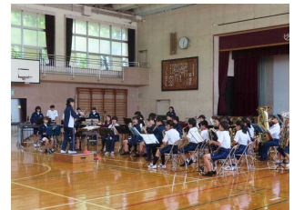
吹奏楽部(リハーサル)

暑い中、本当にお疲れ様でした。そしてこの夏休みで引退をした3年生、これまでの体験をこれからは活かしてください。