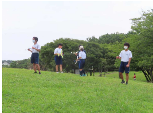
飛行体大会(PC 情報部)