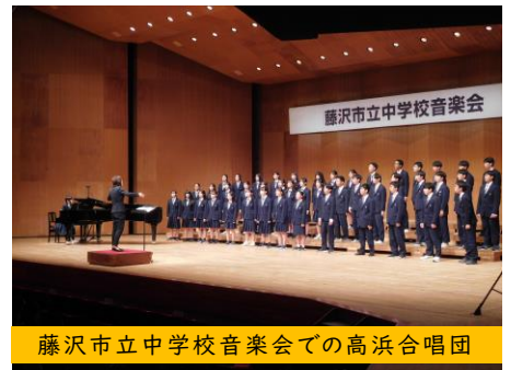
藤沢市立中学校音楽会での高浜合唱団

高浜中伝統のひとつとも言える“人々を感動させる合唱”をこれからも継承していけるとよいですね。